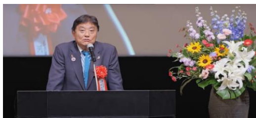
名古屋市市長 河村 たかし氏