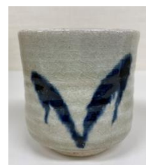
「記念品」喜多窯 霞仙 十二代 加藤裕重 作