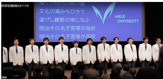
明治大学グリークラブ